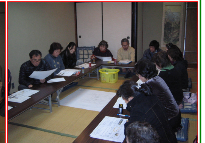
▲計画案の内容を確認しています