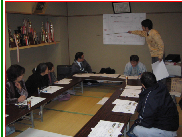
▲計画案を説明しています