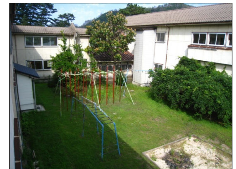
▲施工場所：旧中村小学校の中庭