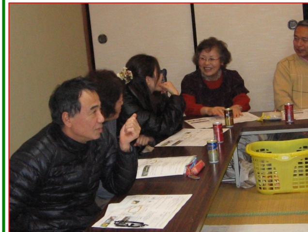
▲意見交換を行いました