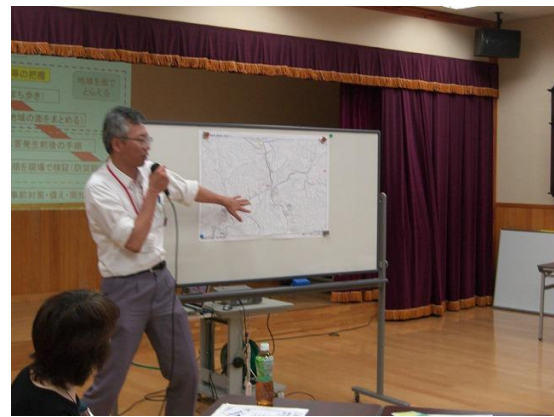
地域防災学習実施の様子