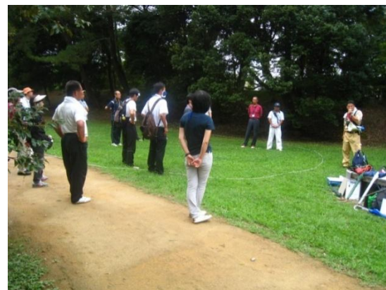
ネイチャーゲーム実施の様子

地域戦略研究所では、環境教育・自然体験プログラムの企画・立案・実行・サポート等を行います。屋外での身近な自然体験を基本に、ご希望に応じて柔軟に対応致します。プログラムの内容についてはぜひお気軽にご相談下さい。