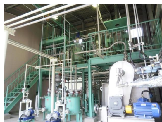
木質バイオマスのパイロットプラント

このように里山・里海再生のなかで、再生可能な植物バイオマスに準じた循環型社会を目指し、林業・漁業の振興、地域雇用確保、観光振興等を進め、隠岐の島を元気にします。