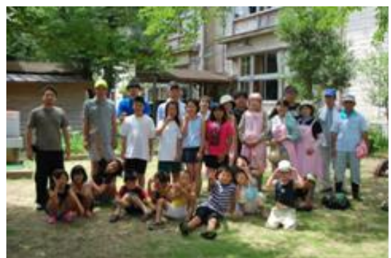
布施地区：川遊びと民話の伝承