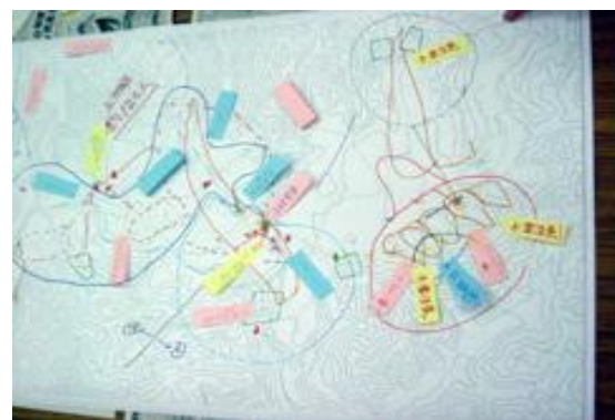
災害図上訓練による危険個所確認結果