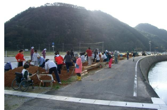
住民施工実施（県道の残地の活用）