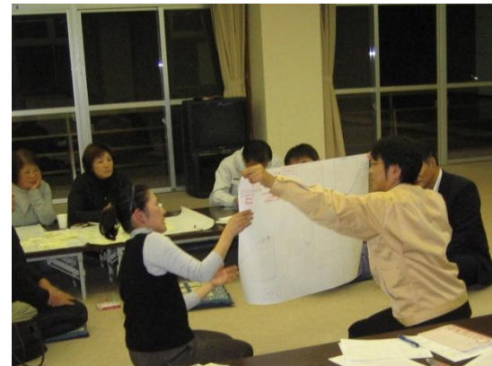
ワークショップ実施（廃校の活用）

今後の社会資本整備においては、今以上に地域住民が計画から施工・維持管理まで積極的に関わる事業推進手法が必要となっています。このような手法を効率的・効果的に実施するためには、「エリアマネジメント」や「新しい公共」の考え方の導入など、これまでの考え方に捉われない地域課題解決に向けた新たな提案が必要と考えます。