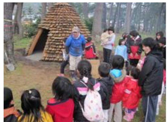
武良地区：松ぼっくりハウス制作

私の姿勢として、地域の再生に携わるためには、その地域に深く関わる必要があると考えています。地域と長く関わり、信頼してもらうことで私たちの提案もしっかりと受け止めていただくことができると思っています。また、その長い関わりこそが地域に根ざしたコンサルタント、シンクタンクが持つ強みであり、使命でもあると考えています。