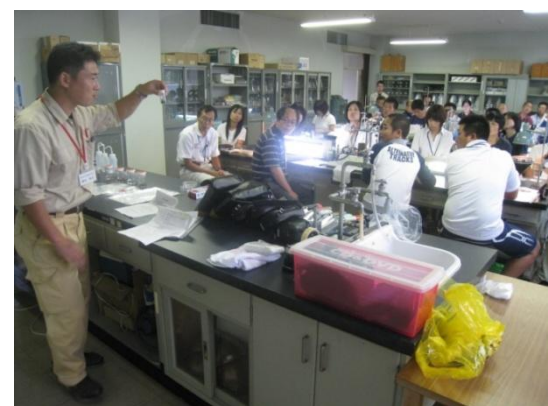
土壌生物による土の豊かさ測定の様子