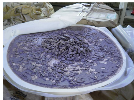
精製したリグニン